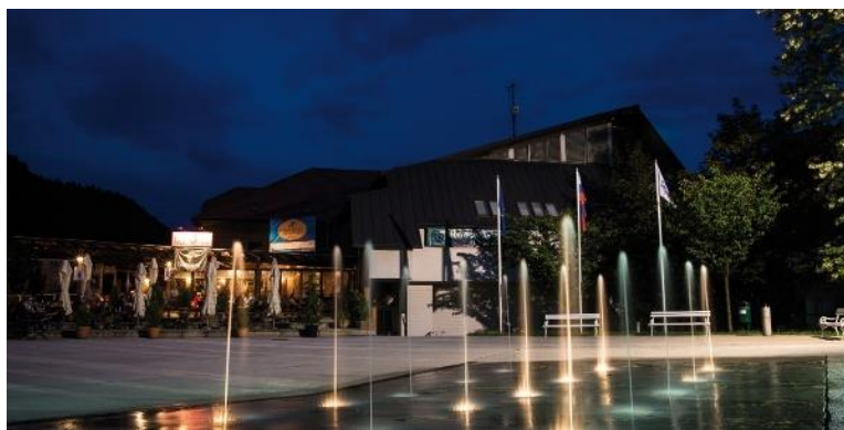
Slika 15: Trg Toneta Čufarja

Stoji v osrednjem delu Jesenic in je bil zgrajen leta 1930 kot »Krekov prosvetni dom.« V njem je vse do druge svetovne vojne potekala kulturna dejavnost. Med 2. svetovno vojno je imel okupator je v njem skladišče, po osvoboditvi pa so se v njem zadrževali jugoslovanski vojaki. Po vojni se je dom preimenoval v »Titov dom«. V na novo imenovanem Titovem domu je bilo od 1945 naprej osrednje gledališče.