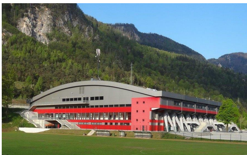
Slika 5: Športna dvorana Podmežakla

V zimskem času je dvorana prizorišče hokejskih tekem, v njej pa se odvijajo tudi treningi in tekmovanja umetnostnih drsalcev. V poletnem času so v dvorani organizirana tekmovanja v in-line hokeju, pogosto pa so tam prirejeni tudi koncerti. Šport, ki je najbolj zaznamoval železarsko mesto, je vsekakor hokej. Prvo tekmo je jeseniško moštvo odigralo v sezoni 1941/42. Takrat je hokejiste združevalo le veselje do igre. To pa je bilo premalo za napredek. Velika sprememba je prišla v sezoni 1953/54, ko so na Jesenicah zgradili prvo slovensko umetno drsališče. Pridobitev je bila pomembna za napredek športa, saj je podaljšala sezono in omogočala kvalitetnejši trening. Prvi uspeh je prišel leta 1957 v Beogradu, ko je jeseniško moštvo postalo prvič državni prvak. V bivši državi so Jesenice to lovoriko osvojile triindvajsetkrat. Poseben čar so dobili derbiji z ljubljansko Olimpijo. Niso pomenili le športnega dvoboja, ampak mnogo več. Dobili so pomen dvoboja, med premožnim centrom in zapostavljeno periferijo. V njej so se videli tudi ljudje iz ostalih slovenskih krajev.