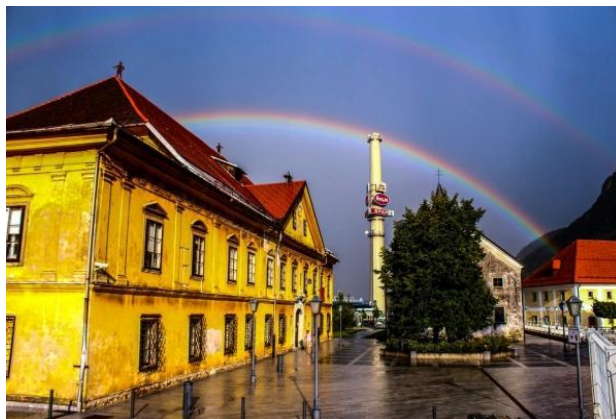
Slika 9: Buccelleni-Ruardova graščina

neuspešno poskušal posodobiti železarsko proizvodnjo. Posledica tega je bila, da je lastništvo nad savskimi obrati in graščino leta 1871 prešlo na Kranjsko industrijsko družbo. Zatem so se graščinski prostori uredili v uradniška stanovanja. Leta 1954 je bila graščina preurejena v muzej, danes je graščina v fazi obnove.