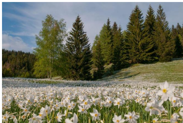
Slika 1: Narcise na Golici

Občina Jesenice ima izredno kulturno kot tudi naravno dediščino. Poleg fužinske zgodovine, okolica nudi ogromno možnosti za bližnje izlete v naravo. Tako se lahko pohodniki odpravijo slapa Šum, Zoisovega parka na Javorniškem Rovtu nad Jesenicami, Hruške planine in seveda Golice, ki je zahvaljujoč bratom Avsenik, ena izmed najbolj znanih planin. Golica pa ne slovi samo po najbolj znani polki na svetu ampak tudi po narcisnih poljanah.