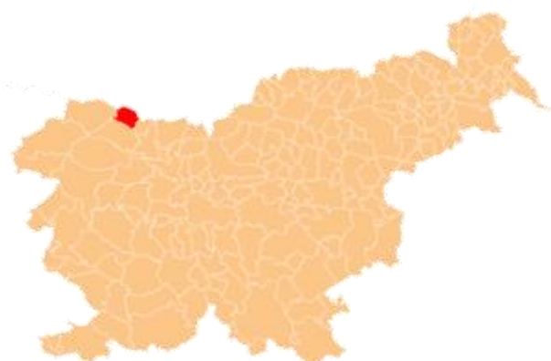
Slika 3: Občina Jesenice

Občina Jesenice je po številu prebivalstva dobrih 21.000 ena izmed večjih občin v Republiki Sloveniji s središčem na Jesenicah, kjer živi okoli 2/3 prebivalstva občine. Župan Jesenic je Blaž Rečič. Površina te občine je dobrih 75,8km 2 . Povprečna starost je 41,09 let. Občina se razprostira na skrajnem severozahodu Slovenije. Na severu jo omejuje avstrijska meja za Klekom, Golico in Sedlom Suha, na zahodu pa karavanški predor, ki je ob enem tudi najkrajša cestna povezava Gorenjskega in širšega slovenskega območja z Zahodno Evropo. Obsega večji del Doline na Savi ter stranske gorske doline med Karavankami in visokimi grebeni Julijskih Alp.