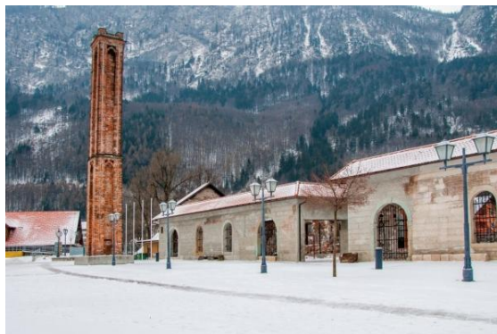
Slika 13: Plavž

Plavž ali Visoka peč je industrijska talilna peč za pridobivanje surovega železa iz oksidnih rud z redukcijo in taljenjem na visoki temperaturi. Plavž kot srce fužine je bil zasnovan že v 16. stoletju. Sledile so številne predelave. Zadnja in največja se je zgodila v drugi polovici 19. stoletja. Objekti so bili opuščeni z izgradnjo sodobne železarne in jih je močno načel zob časa. Konservatorski posegi so preprečili njihovo nadaljnjo propadanje in iz njih ustvarili muzej na prostem, kjer obiskovalec lahko spozna nekdanjo železarsko tehnologijo.