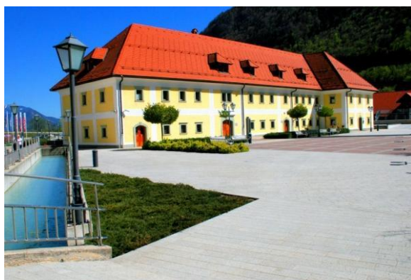
Slika 10: Stanovanjska hiša Kasarna

Kasarna je poznobaročna stavba iz konca 18. stoletja. V času Napoleonovih vojn je služila kot vojašnica francoskih vojakov, kasneje pa so v njej dobile svoja stanovanja delavske družine. Leta 2005 je bila stavba temeljito obnovljena. V njej sta svoje prostore dobila Glasbena šola Jesenice in Gornjesavski muzej Jesenice. Tukaj se je rekonstruiralo delavsko stanovanje iz obdobja tridesetih in štiridesetih let 20. stoletja, ki prikazuje bivalno kulturo in način življenja železarskih družin v nekdanjem jeseniškem delavskem naselju. V Kasarni potekajo muzejske delavnice za vse starostne skupine, imajo pa še manjšo galerijo, fototeko in arhiv Kranjske industrijske družbe.