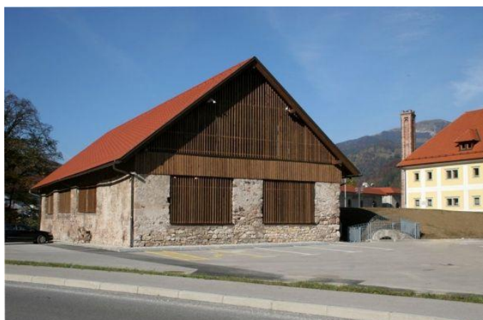
Slika 12: Kolpern

Skladišče za lesno oglje - kolpern je stalo ob plavžu, kjer so oglje uporabljali kot gorivo za taljenje železove rude. Na karti iz leta 1808 je vrisana manjša kvadratna stavba na prostoru zahodno od današnjega kolperna. Stavbo so kasneje dograjevali in v katastru iz leta 1868 je predstavljena v sklopu treh med seboj povezanih skladišč. Z opustitvijo plavža konec 19. stoletja se je njihova namembnost spremenila. Ohranila se je le ena stavba, ki jo je leta 2009 obnovila Občina Jesenice.