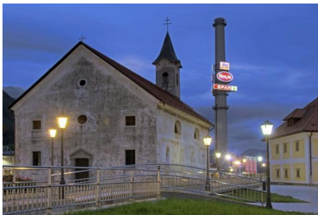
Slika 11: Cerkev Marijinega vnebovzetja