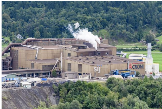
Slika 7: Acroni Jesenice

Konec 18. stoletja, so Zoisi zašli v velike finančne težave, predvsem zaradi zastarelih obratov, visokih proizvodnih stroškov ter tuje konkurence. Večji del njihovega premoženja je bil že v tujih rokah. Zato do leta 1869 sporazumno s svojimi upniki ustanovili delniško družbo pod imenom Kranjska industrijska družba (KID). Tri leta kasneje je tudi Ruard zaradi podobnih težav kot Zoisi pristopil kot delničar h KID. Z dnem, ko je Ruard pristopil h KID, se je pričela nova era železarstva v jeseniški dolini. Dve obsežni fužini sta se združili v celoto - največjo industrijo v Vojvodini Kranjski. Jesenice so postajale razvito mesto. Iz fužin je na Savi zrasla moderna železarna, kraj pa je dobival industrijsko podobo in je omogočal razvoj drugim panogam.