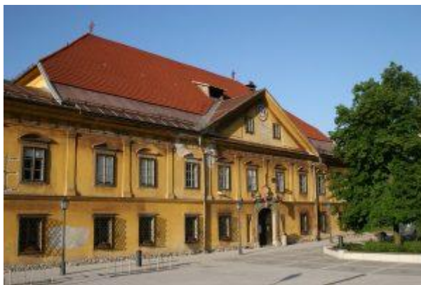
Slika 8: Gornjesavski muzej