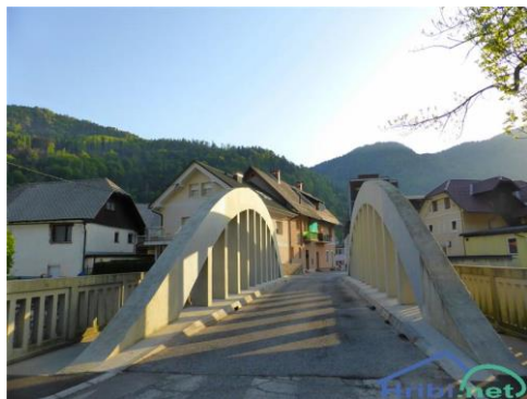
Slika 6: Hermanov most

Most je povezoval občini Gorje in Jesenice. Po letu 1926, ko je povodenj odnesla most na Javorniku, se je promet čez most pri Hermanu zelo povečal in nastala je potreba po večjem mostu. Obnovitvena dela so potekala v letih 1930 in 1931. Leta 1962 so mostu dali današnjo obliko.