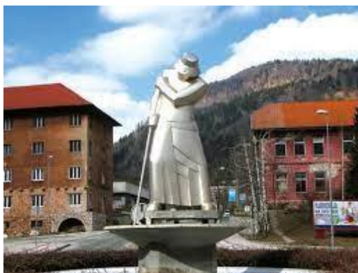
Slika 14: Spomenik železarjem in železarstvu